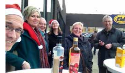
▲ Enkele N-VA leden tijdens de Bednet actie.

Ook dit jaar droeg N-VA Overpelt haar steentje bij aan Music for Life, de jaarlijkse solidariteitsactie van Studio Brussel. Voor deze editie viel onze keuze op Bednet.