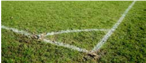
Wanneer komen nieuwe sportvelden er? p.2