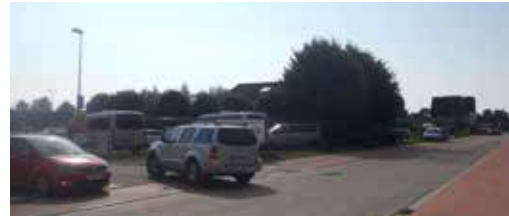
Leopoldlaan: eerst doen, dan pas denken? p.3