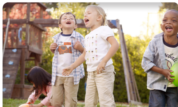
Kinderen vroegtijdig inschrijven en dan laat afzeggen, kan niet langer zomaar.

Helaas zijn de wachtlijsten daarmee nog niet opgelost. De vele geboortes en de vele jonge gezinnen in Overpelt hebben ervoor gezorgd dat er meer opvang nodig is dan er op dit moment voorhanden is. En het zal er de volgende jaren niet op beteren. Het gemeentebestuur heeft de opdracht om dit probleem op te lossen. De N-VA-fractie zal dit nauwgezet opvolgen.